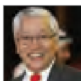
Ambet Yuson Secretario general de la ICM Junio 2018

El documento informativo concluye con una serie de recomendaciones a la FIFA con la firme convicción de que la adopción de estas medidas podría resultar muy útil para poner fin al juego sucio en este bello deporte.