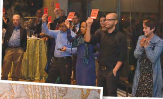
Arbeitsbedingungen auf olympischen Baustellen ausarbeiten würde.

Dank dieser strategischen Säulen war es der BHI möglich, im Verlauf ihrer Olympiakampagne in Brasilien verschiedene wichtige Ziele zu erreichen. Auf dem Zenit der Bautätigkeiten organisierten die der BHI angeschlossenen Gewerkschaften 50.000 Arbeitnehmer.