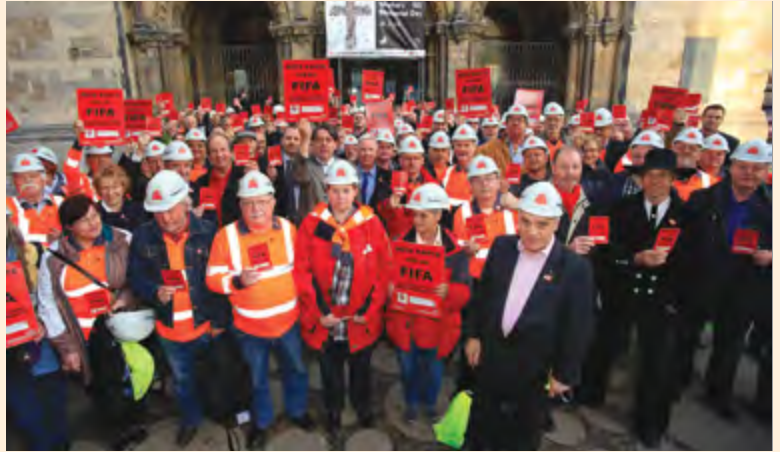
IG BAU gedenkt Opfern von Arbeitsunfällen anlässlich des Workers' Memorial Day (Arbeitergedenktag) in Berlin

Auf dem Weg zum Hotel gegen 22 Uhr sehen sie, dass noch immer überall gebaut wird. Während ihrer Inspektionen im Oktober 2018 besuchen sie die Arbeiterunterkünfte. Im Vergleich zu den Unterkünften anderer Baustellen sind jene für die Arbeiter auf den Baustellen zur Weltmeisterschaft gut. Alles in allem