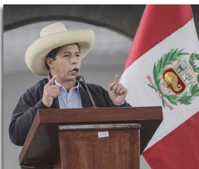
Pedro Castillo, presidente electo en Perú

Promoción de debates entre afiliados sobre procesos políticos relacionados con las elecciones en Ecuador, Honduras, México y Perú.