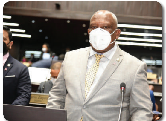
Presidente de FENTICOMMC, Pedro Julio Alcántara, electo en la Cámara de Diputados de la República Dominicana